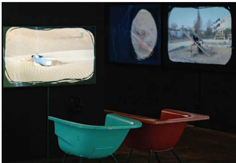
Khalid Seddiq, Bathtub Chairs , 2017.