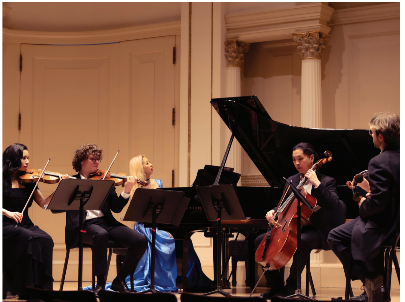
يقدم موسيقيو جمعية موسيقى الحجرة التابعة للأمم المتحدة عروضهم في قاعة ويل ريسيتال في كارنيجي هول.

احتفاءً ب اليوم العالمي للغة العربية قدّم مهرجان أبوظبي، بالشراكة مع جمعية موسيقى الحجرة التابعة للأمم المتحدة، حفلاً موسيقياً خاصاً أقيم في قاعة وايل ريسيتال بكارنيجي هول في مدينة نيويورك، إحدى أعرق وأهم الصروح الفنية في الولايات المتحدة الأمريكية، كجزء من فعاليات برنامج مهرجان أبوظبي في الخارج. ويكّرم هذا الحدث السنوي الإرث الثقافي والفكري الغني للغة العربية، ودورها الهام والمؤثر في تطوّر الفنون والعلوم عبر العصور. وتضمّن البرنامج أمسية موسيقية أسرة اشتملت على مختارات من الموسيقى العربية الكلاسيكية والمعاصرة، مسلطة