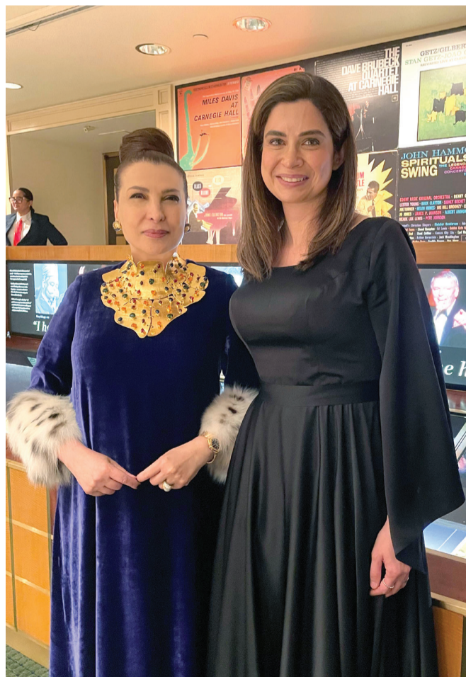
سعادة هدى إبراهيم الخميس، مؤسس مجموعة أبوظبي للثقافة والفنون، المؤسس والمدير الفني لمهرجان أبوظبي، مع عازفة التشيللو الإماراتية إلهام المرزوقي خلال زيارة سعادتها إلى الولايات المتحدة الأمريكية في نوفمبر الماضي.

بقلم: شيخة محمد الكعبي، القيادات الإعلامية الشابة