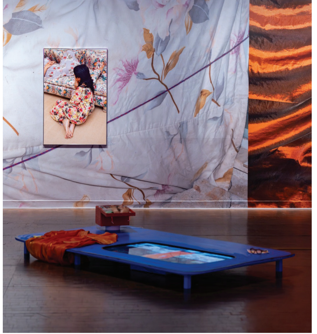
قسم "فضاء للتحوّل" في معرض "روافد ورؤى" الشهير في متحف سيول الوطني للفنون.