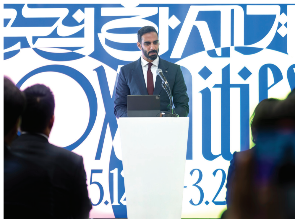
UAE Minister of Culture, H.E. Sheikh Salem bin Khalid Al Qassimi speaking at the opening of Proximities .