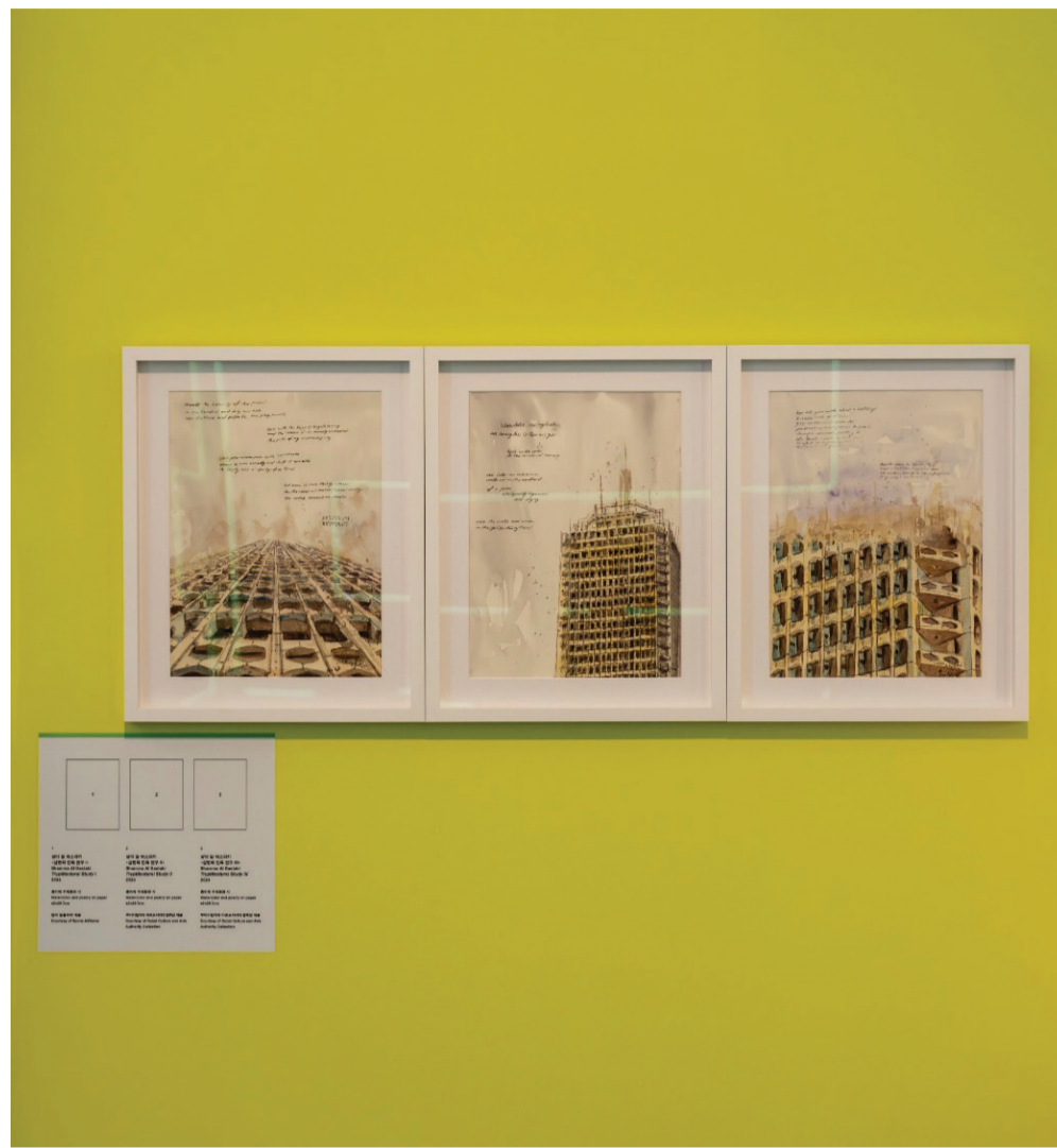
Shamma Al Bastaki, Tryptitectural Study I, II, III , 2024.