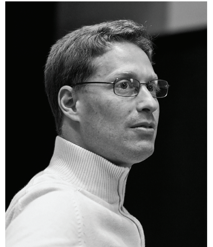
الفائز بالجائزة الأولى في فئة الأوركسترا دانييلي غاسباريني عن مقطوعته الموسيقية "في الهواء الطلق".