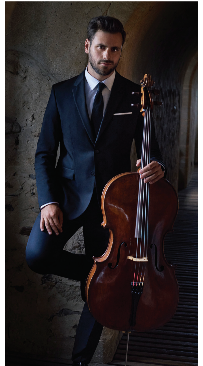
سيُقدم عازف التشيللو الشهير هاويزر أداءه الذي يبرز شغفه بالموسيقى في عرض إماراتي أول خلال شهر مايو القادم في الاتحاد أرينا أبوظبي.