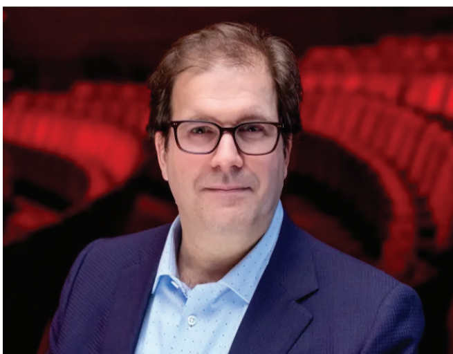
ماتياس تارنوبولسكي، الرئيس والمدير التنفيذي لأوركسترا نيويورك الفلهارمونية.

لأعمال أوركسترا، وبرامج الإقامة الفنية أو الجولات الموسيقية في أبوظبي، إضافة إلى فرص دعم المؤلفين الموسيقيين الإماراتيين والعرب، والموسيقيين الصاعدين، من خلال برامج التعليم وتنمية المواهب. وأعرب الجانبان عن اهتمامهما بتطوير شراكة طويلة الأمد تُسهم في تعزيز الحوار الثقافي وإثراء المشهد الموسيقي في أبوظبي، بما يعكس التزاماً مشتركاً بالتبادل الفني العابر للحدود.