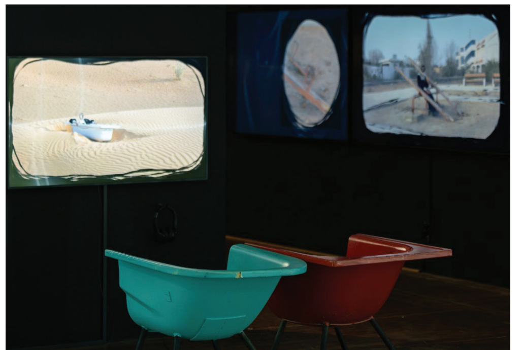
خالد صديق، كراسي البانيو، 2017.