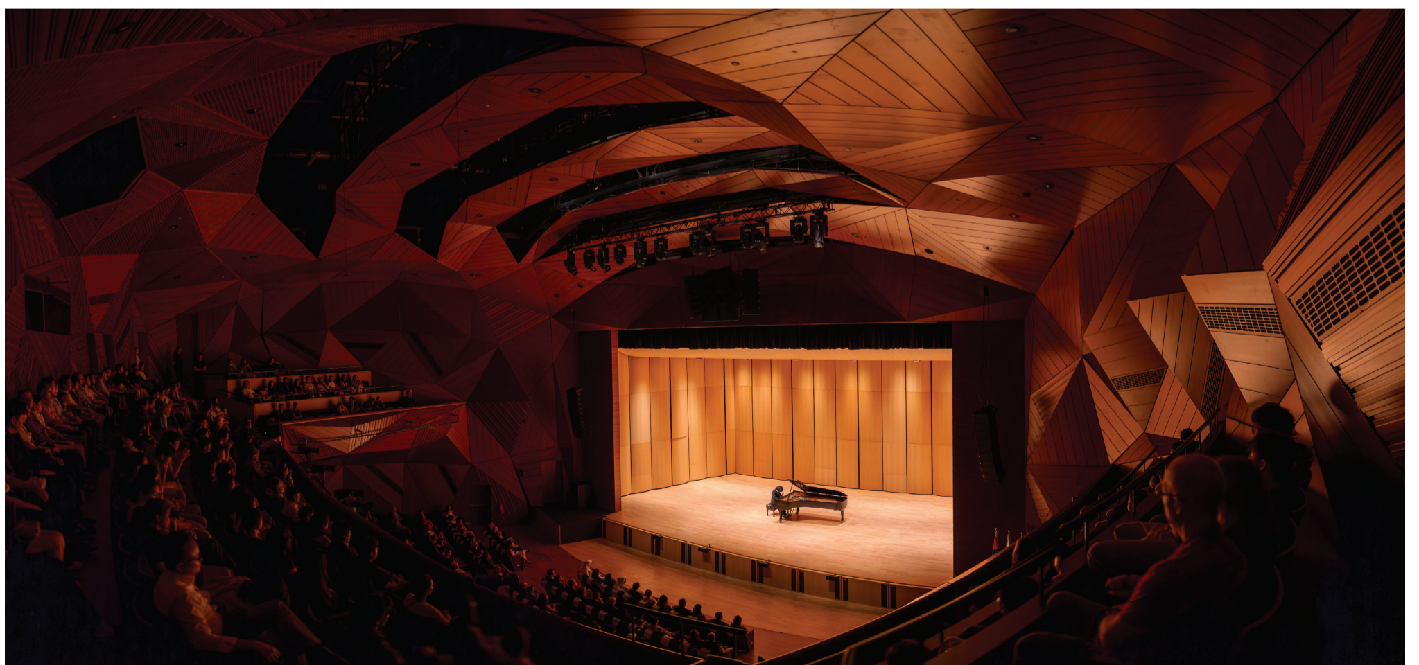
Piano prodigy Yunchan Lim performing at the Red Theater, The Arts Center at NYU Abu Dhabi at Abu Dhabi Festival 2025.