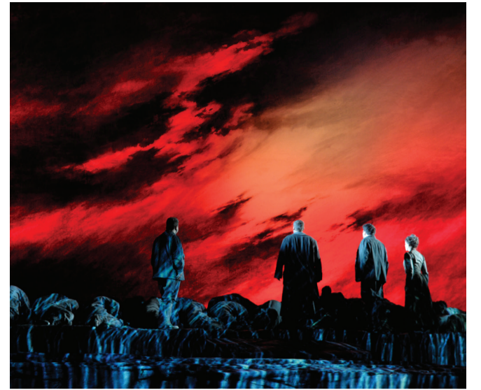
Abu Dhabi Festival's co-production of The Flying Dutchman (2020) with the Metropolitan Opera and Opéra de Québec, in partnership with Mubadala, at New York's Metropolitan Opera.

The meeting also explored potential collaboration on The Metropolitan Opera's Wagner Ring Cycle (2028-2030), alongside discussions on education, contemporary opera and support for new composers. The meeting concluded with agreement to continue strategic discussions and strengthen collaboration, reaffirming opera's role in cultural diplomacy and global exchange.