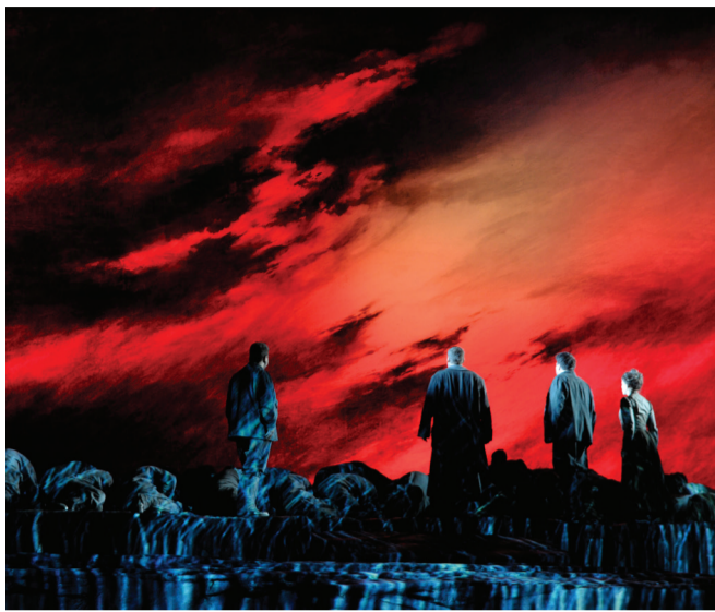
إنتاج مهرجان أبوظبي المشترك لأوبرا "الهولندي الطائر" (2020) مع دار أوبرا المتروبوليتان وأوبرا كيبيك، بالشراكة مع مبادلة، في دار أوبرا المتروبوليتان بنيويورك.

عروض الدار العالمية. وتناول الاجتماع أيضاً إمكانات التعاون المستقبلي في إطار دورة "الخاتم" لريتشارد فاغنر التي تخطط لها دار أوبرا المتروبوليتان خلال الفترة 2028 - 2030، إلى جانب مناقشات حول التعليم، والأوبرا المعاصرة، ودعم المؤلفين الجدد. واختتم اللقاء بالاتفاق على مواصلة الحوارات الاستراتيجية وتعزيز مسارات التعاون، بما يؤكد دور الأوبرا في الدبلوماسية الثقافية والتبادل العالمي.