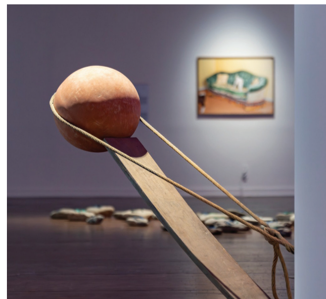
Shaikha Al Mazrou, Balance I , 2017.