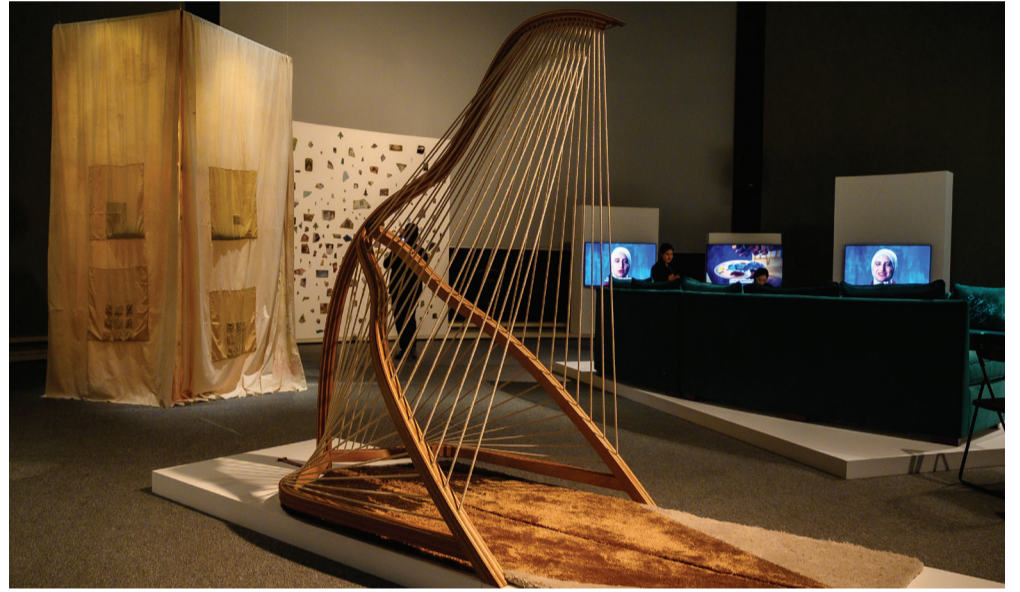
محراب مصطفى زكريا، 2025 (بيت الحرفيين) - أحد المشاريع الملهمة التي تعكس قيم المجتمع باعتبارها ذاكرة ومستقبلاً وحواراً.