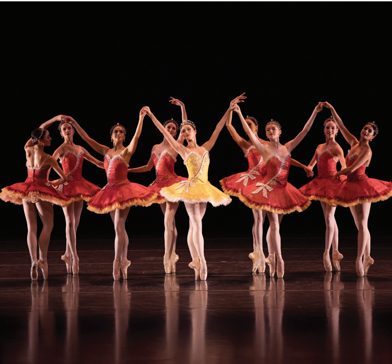
يعتلي راقصو مسرح الباليه الأمريكي خشبة مسرح مهرجان أبوظبي يوم 17 أبريل 2026.