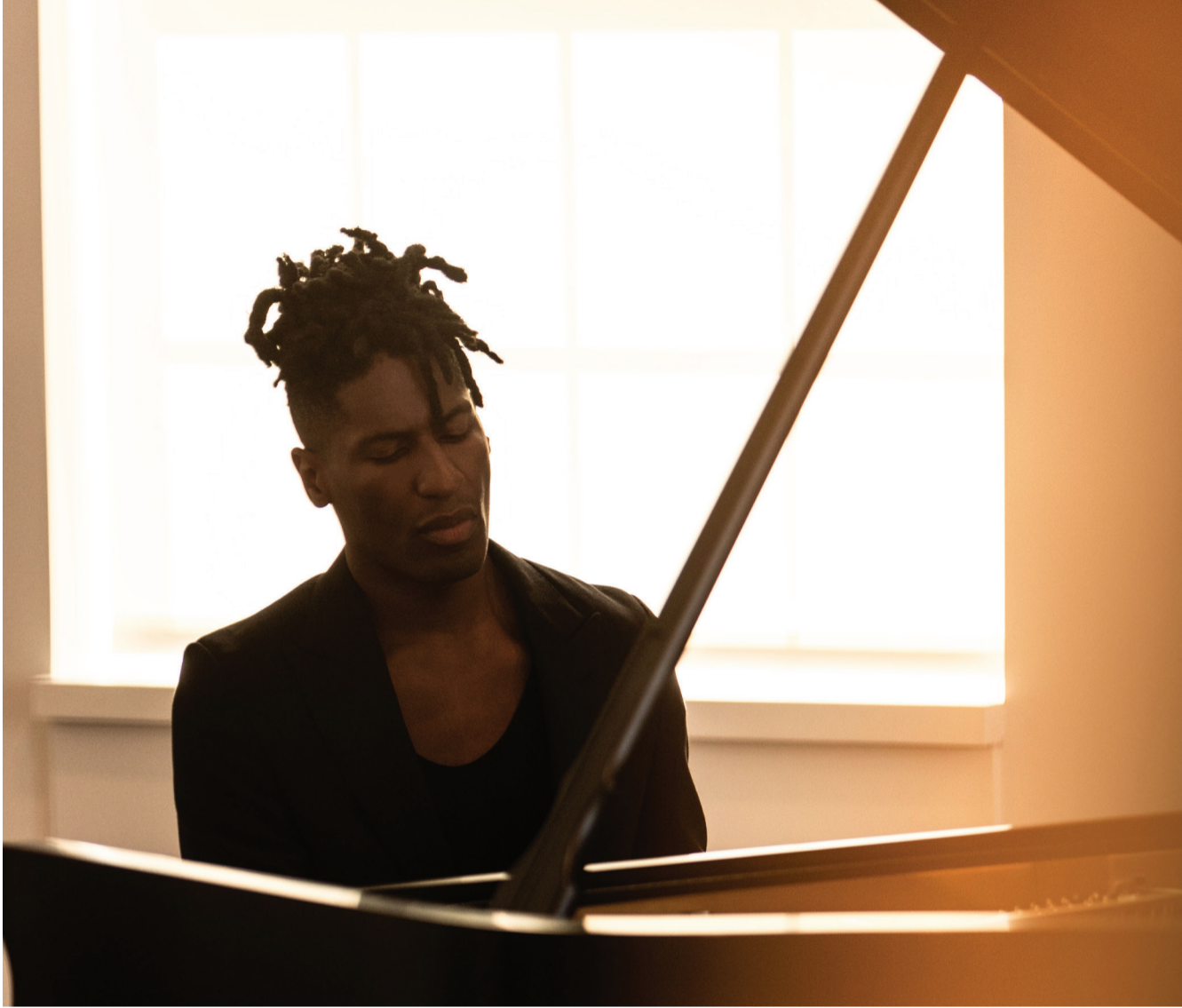
يقدم الفنان جون باتيست، الحائز على عدة جوائز غرامي وأوسكار، عرضه "مايسترو" في أبوظبي ضمن الحفل الافتتاحي لمهرجان أبوظبي في قصر الإمارات ماندارين أورينتال.

ويُحيي عازف التشيللو ونجم الموسيقى الكلاسيكية هاويزر حفلاً في قاعة الاتحاد أرينا يوم 2 مايو، مواصلاً بذلك حضور المهرجان في تقديم الحفلات الكلاسيكية الكبرى ذات الطابع الجماهيري. كما يشارك المؤلف والموسيقي وعازف العود المبدع ظافر يوسف في البرنامج من خلال حفل يُقام في المسرح الأحمر بجامعة نيويورك أبوظبي يوم 14 أبريل، مقدّماً برنامجاً يستند إلى التقاليد الموسيقية العربية وشمال أفريقيا، مع توظيف عناصر من الجاز والموسيقى الكلاسيكية الأوروبية. وتبقى الموسيقى الأوركسترالية ركناً أساسياً في برنامج الموسم، حيث تقدّم أوركسترا قطر الفلهارمونية بقيادة المايسترو جاكومو ساغريانتي، وبمشاركة السوبرانو ماريا أغريستا والتينور جورجيو بيروجي، أمسية أوبرا خاصة بأعمال فيردي يوم 21 أبريل في قاعة مسرح قصر الإمارات ماندارين أورينتال، إحياءاً للذكرى