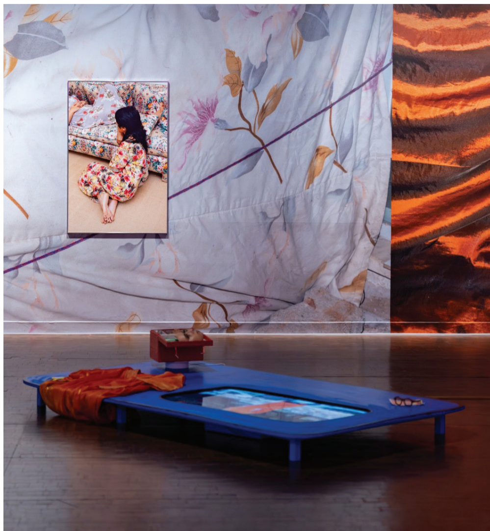
A Place for Turning section at the landmark Proximities exhibition at Seoul Museum of Art.