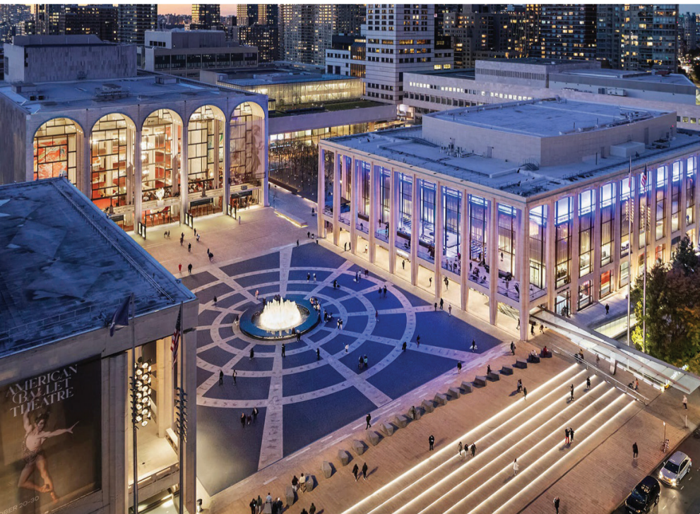
مركز لينكولن للفنون المسرحية، نيويورك.