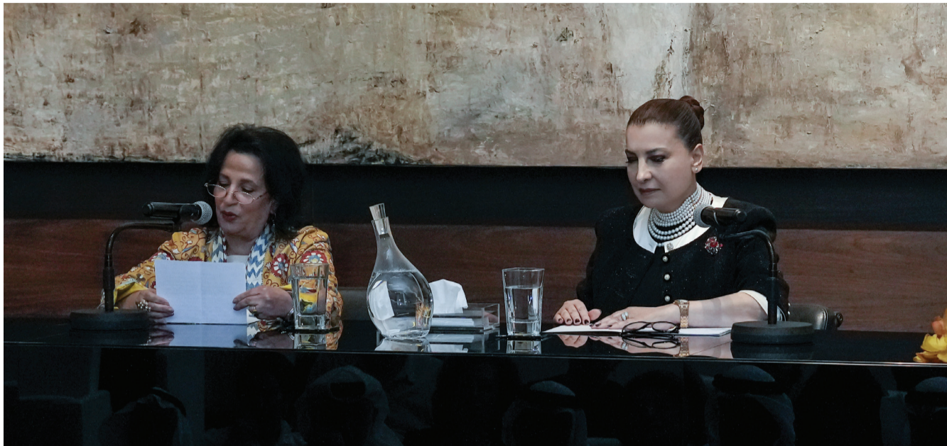
معالي الشخة مي بنت محمد آل خليفة، مؤسسة مركز الشيخ إبراهيم بن محمد آل خليفة للثقافة والبحوث ورئيسة مجلس الأمناء (يسار)، وسعادة هدى إبراهيم الخميس، مؤسس مجموعة أبوظبي للثقافة والفنون، المؤسسة والمدير الفني لمهرجان أبوظبي (يمين).