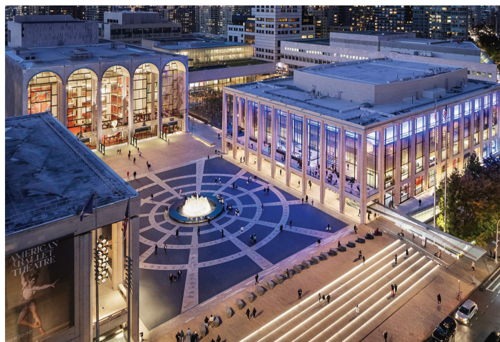
Lincoln Center for the Performing Arts, New York.