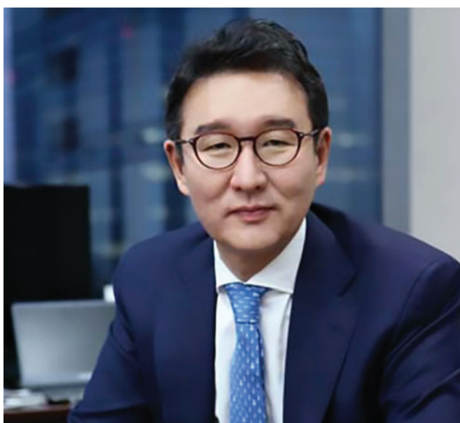
هو يونغ سو، الرئيس التنفيذي لشركة جي إس إنرجي ونائب رئيس مجلس إدارة مجموعة جي إس.