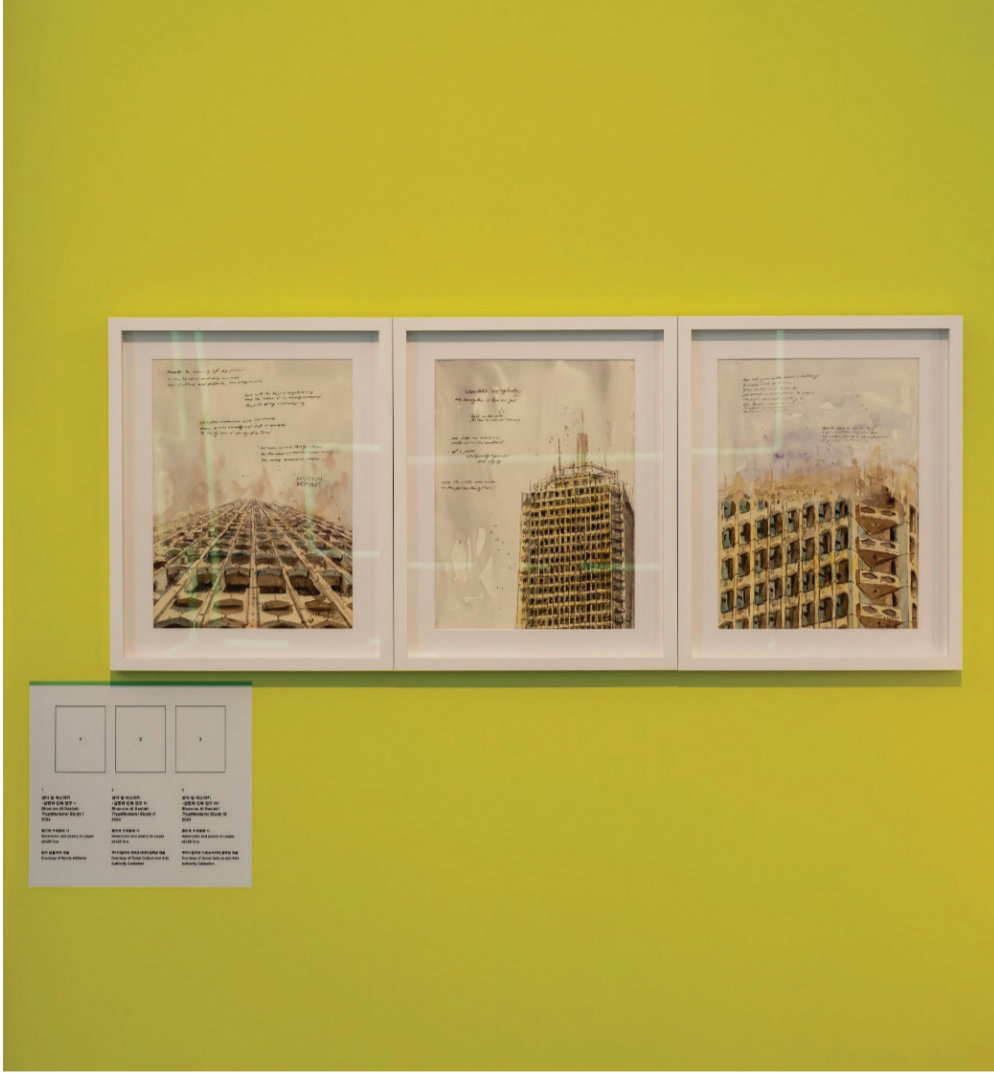
شمة البستي، دراسة التريبتيكنتال الأول، الثاني، الثالث، 2024.