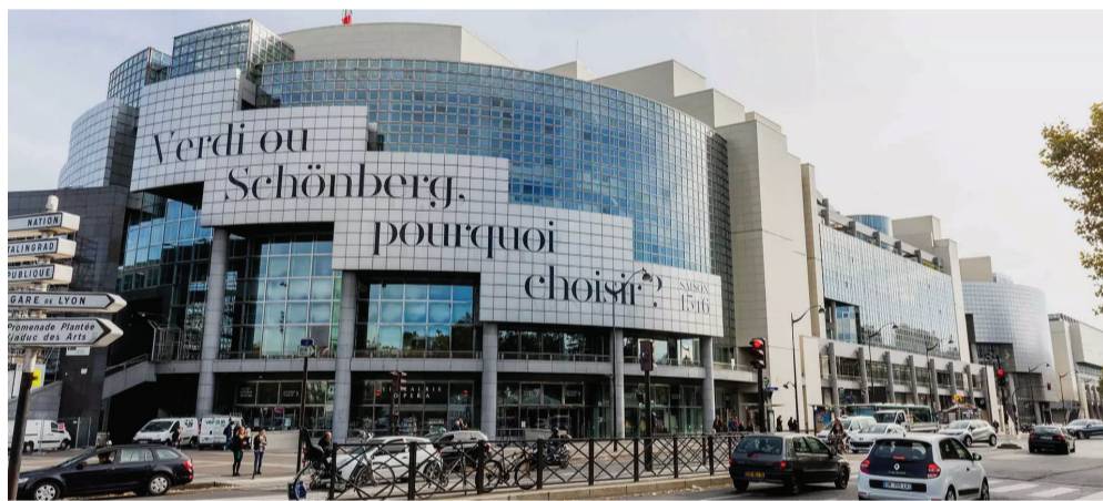
Opéra Bastille in Paris, the main venue of the Opéra national de Paris.