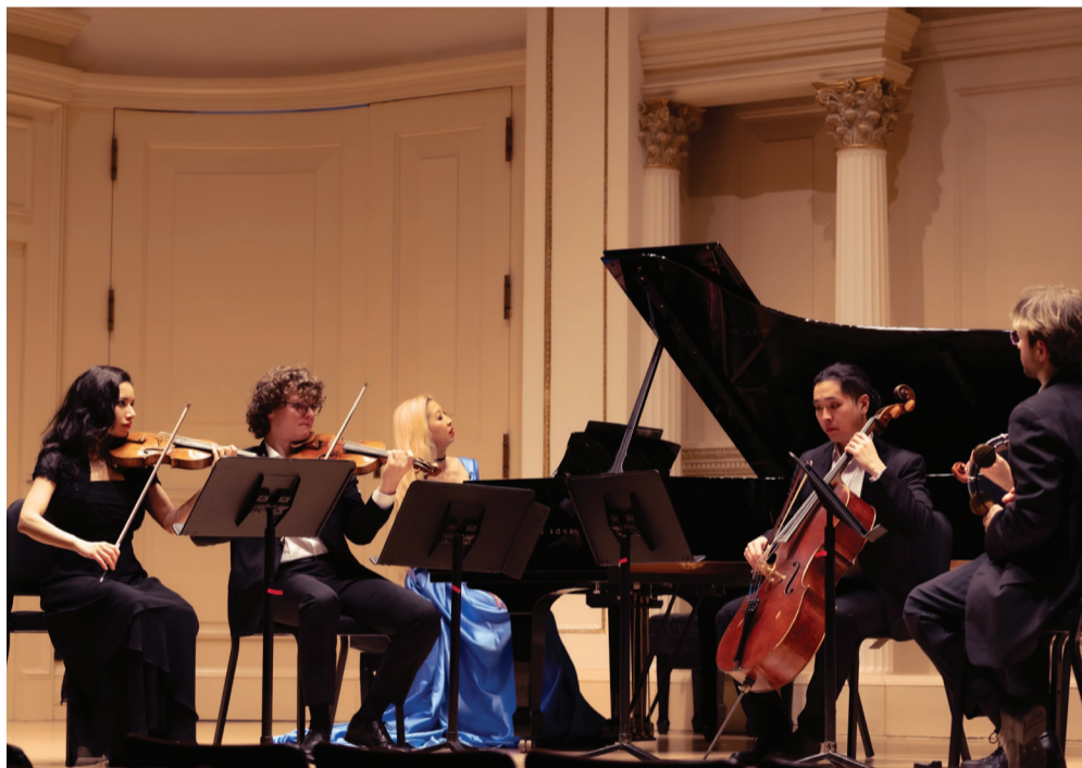
Musicians of the UN Chamber Music Society perform in Weill Recital Hall at Carnegie Hall.