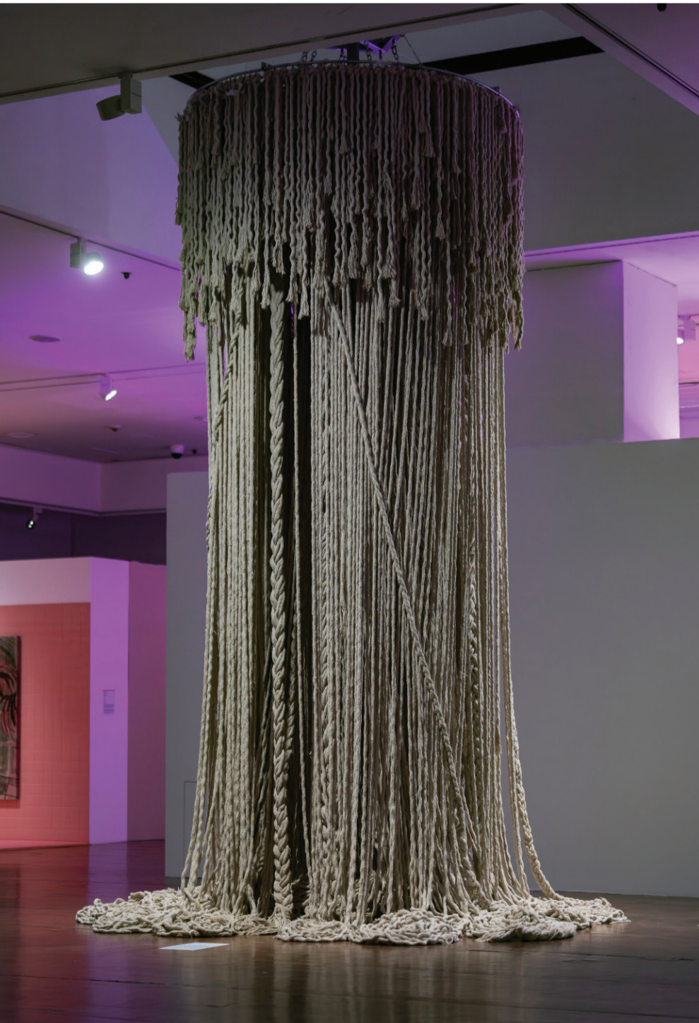
عفراء الظاهري، جدائل، 2021.