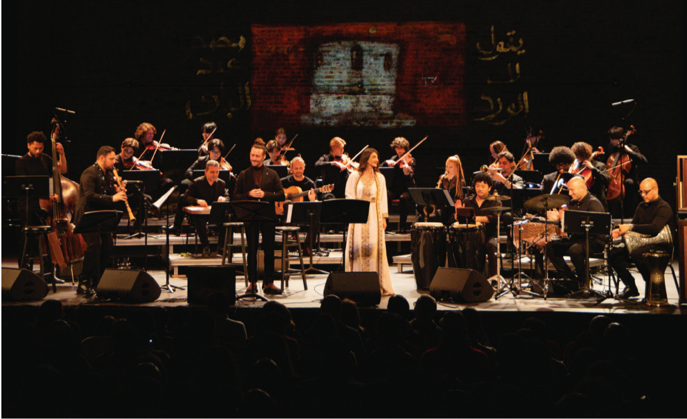
العرض الأول في الولايات المتحدة لألبوم المؤلف والموسيقي فرج أبيض الجديد "شمس وجودي"، والذي تم تقديمه في مدينة نيويورك، مسرح بيتر جاي شارب في سيمفوني سيبس.

وللفنون، لفنانين عرب حديثين بارزين. وقد قدمت هذه الأعمال في حوار بصري مع الموسيقى، لتصنع رحلة حشوية متكاملة عمقت تجربة الجمهور. وكانت بداية هذا الحوار الفني قد انطلقت في مايو 2025، حين تعاون فرج أبيض للمرة الأولى مع مهرجان أبوظبي في متحف المتروبوليتان للفنون، حيث قدم أعمالاً جديدة بتكليف خاص مستلهمة من الشعر العربي. وجاء حفل نوفمبر ليبنى على هذا المسار، مقدماً لجمهور نيويورك لقاءً مؤثراً مع التراث الموسيقي والشعري العربي. ومن خلال تكليف أعمال جديدة ودعم الظهور الأول لفرقة "أوركسترا أثر - نيويورك"، جدد مهرجان أبوظبي تأكيد التزامه بتعزيز التبادل الثقافي والتعاون الفني الدولي، وترسيخ حضور الإبداع العربي على الساحة العالمية.