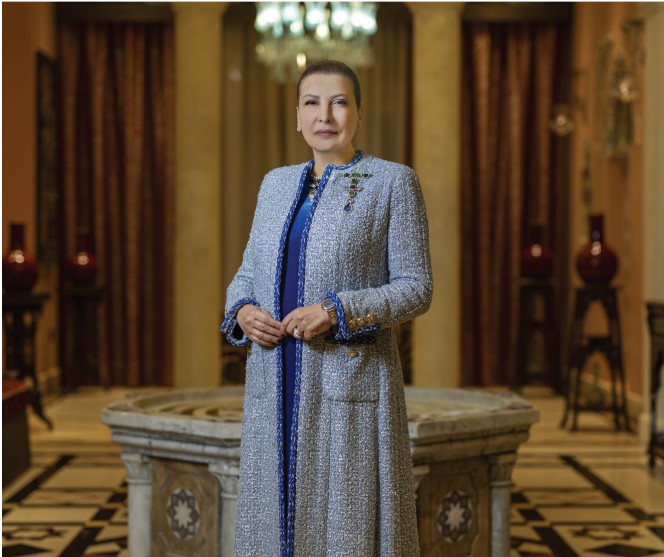
سعادة هدى إبراهيم الخميس، مؤسس مجموعة أبوظبي للثقافة والفنون، المؤسس والمدير الفني لمهرجان أبوظبي، خلال الإعلان عن برنامج الدورة الثالثة والعشرين للمهرجان.

"عندما تحظى هذه الطاقات برباعية مؤسسات قوية، وتضافر جهود القطاعات المختلفة، ومشاركة مجتمعية واسعة، فإنها تولد قدراً أكبر من الحيوية والانفتاح، وتدعم تطور المجتمعات، وتسهم في نمو اقتصادي مستدام، وتفتح آفاقاً أرحب للفرص".