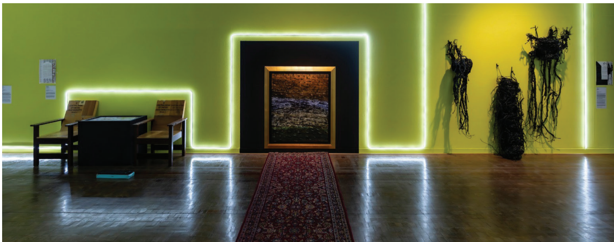
Left to right: Khalid Seddiq, Central Bank Chairs , 2017; Najat Makki, Rhythm of Emotion within Place , 2016; Hassan Sharif, Cable No 2 , 2015.