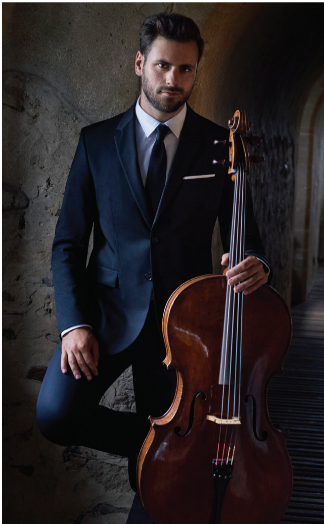
Renowned cellist Hauser will bring his electrifying power and passion to Etihad Arena in May for an unforgettable Abu Dhabi premiere.