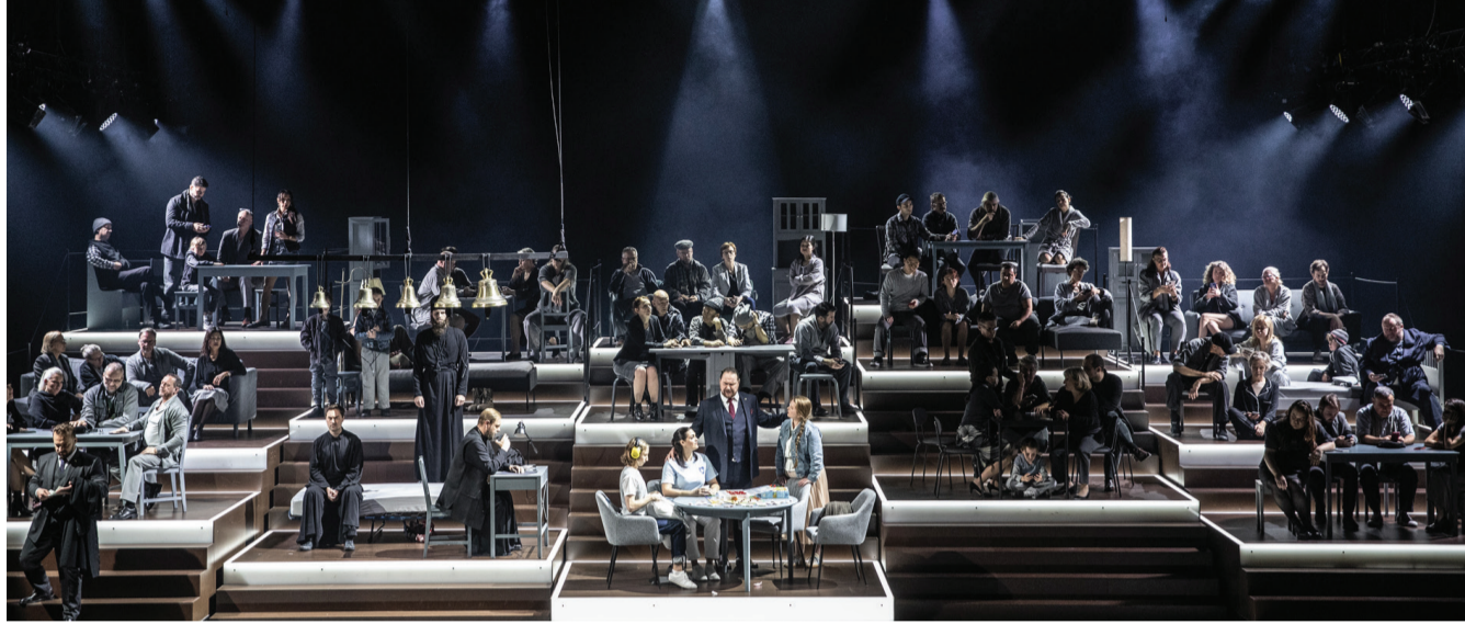
قدمت دار الأوبرا الوطنية في ليون أوبرا بوريس غودونوف الكبيرة لمودست موسورغسكي.