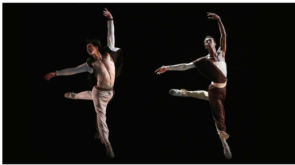
Two dancers of the American Ballet Theatre captured in performance.