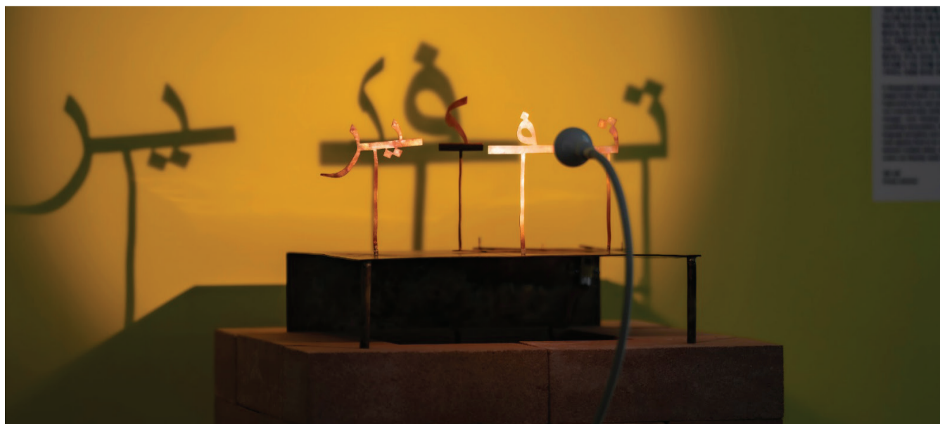
Shamma Al Amri, Suspended Judgement , 2018.