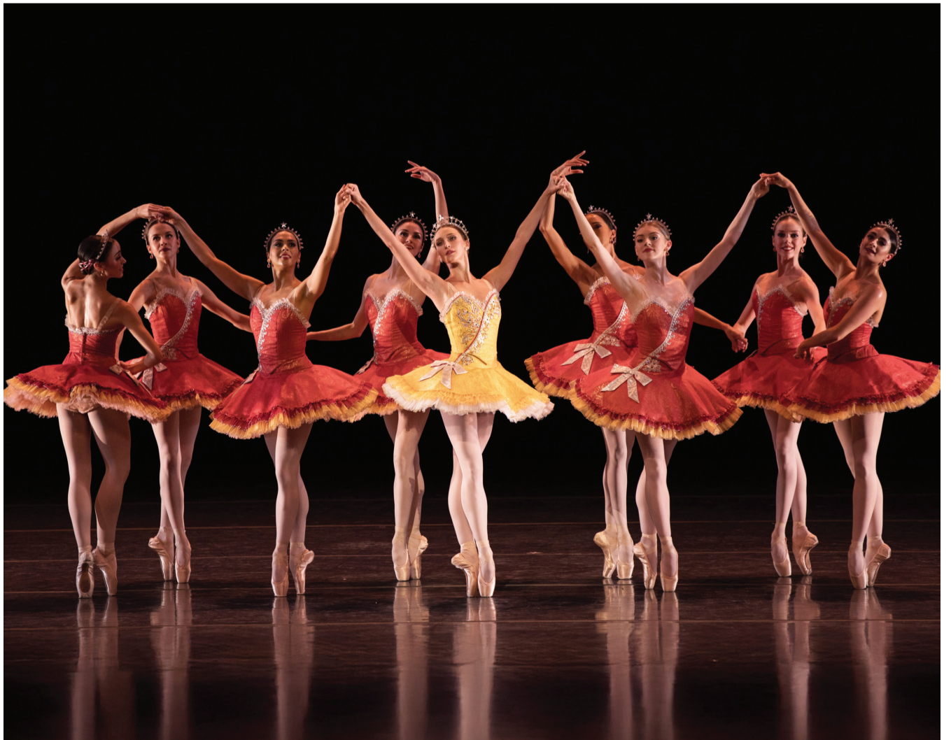
American Ballet Theatre will take to the Abu Dhabi Festival stage on 17 April 2026.