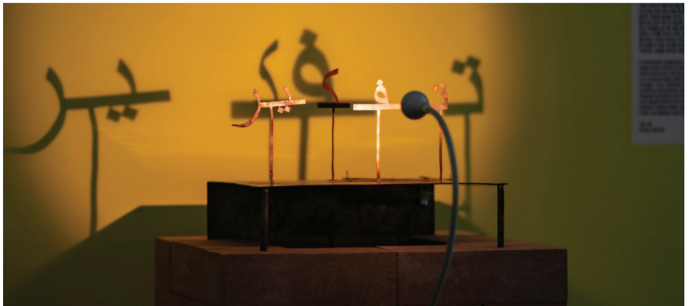
شمة العامري، أحكام مسبقة، 2018.